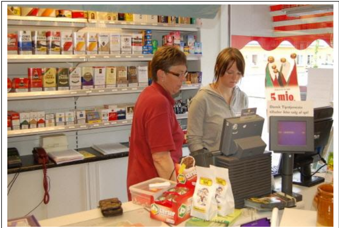
Man snakker om sagerne, der er nok at se til dagen lang.