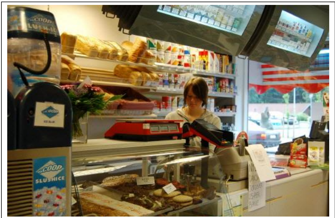
Brødet har også fået et "løft" nu skal man ikke længere stå på hovedet i rundstykkerne.