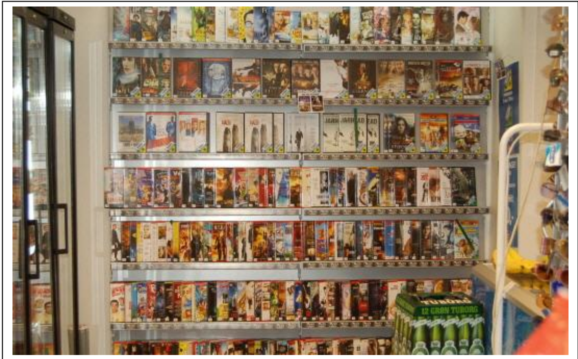
En af de store sællerter har fået meget mere plads