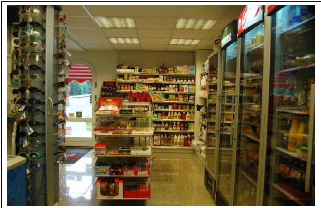
Reelt og nemt at komme rundt.