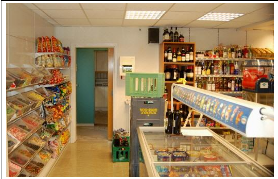
Der er ikke langt til Supermarkedsideen