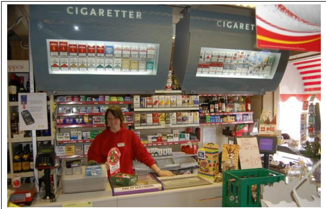
En smilende ekspedient, er et stort aktiv for ”den lille butik”