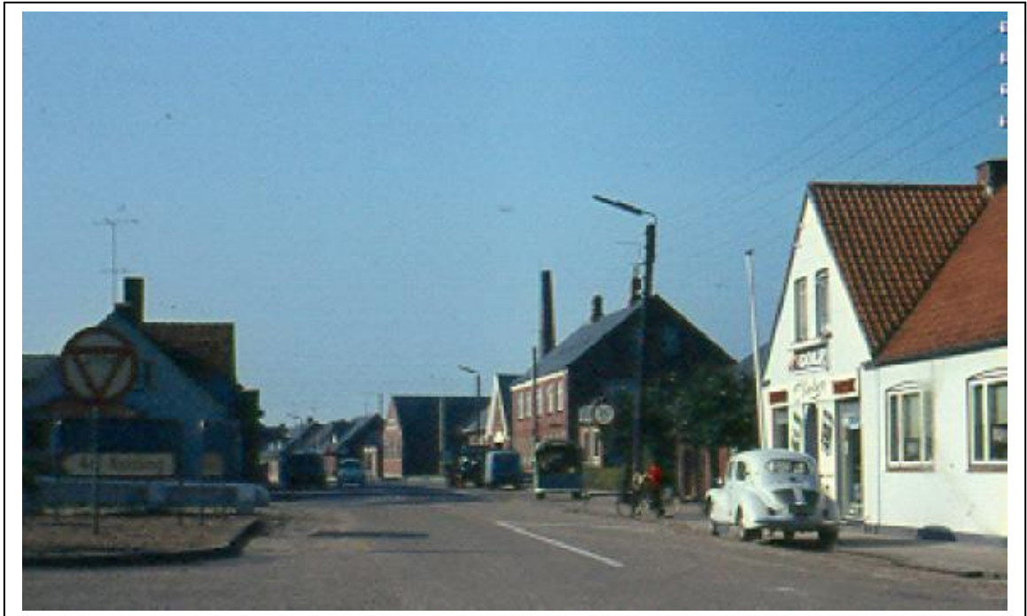
Bybilledet skifter udseende efterhånden som tiden går, her fra ca. 1965