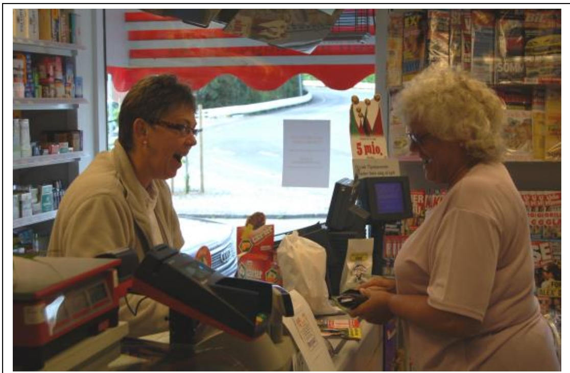
Der er nok en del at more sig over, måske er det fotografen der driller