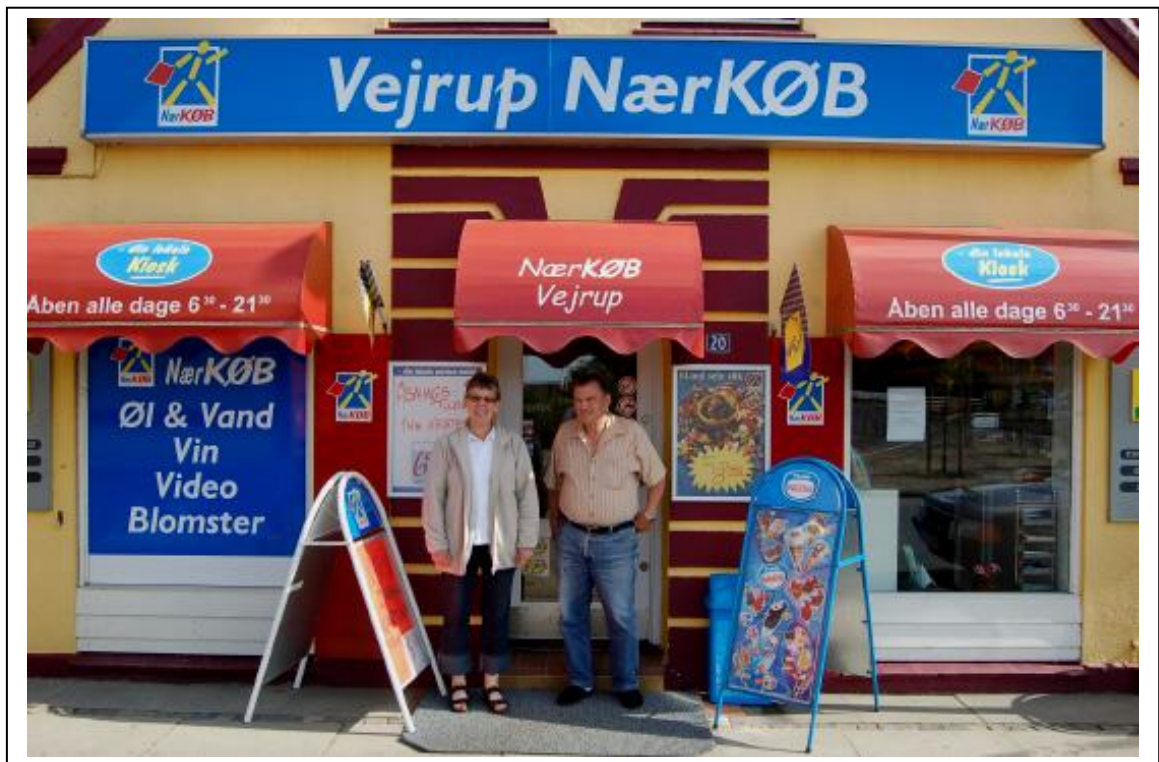
To meget tilfredse personer, der er klar til at fortsætte arbejdet