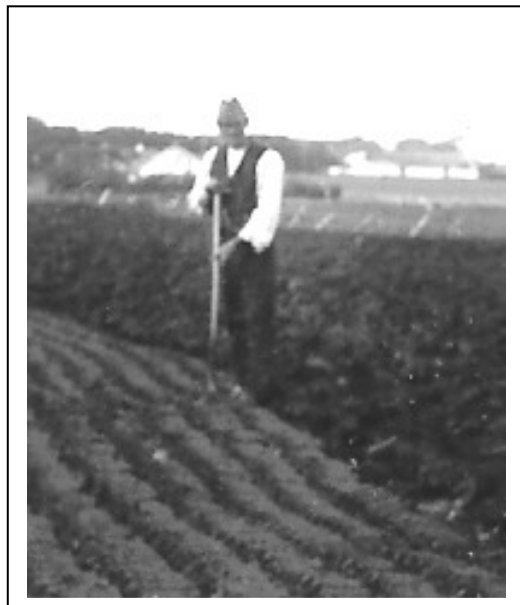
Her vendes tørvene efter udlægning