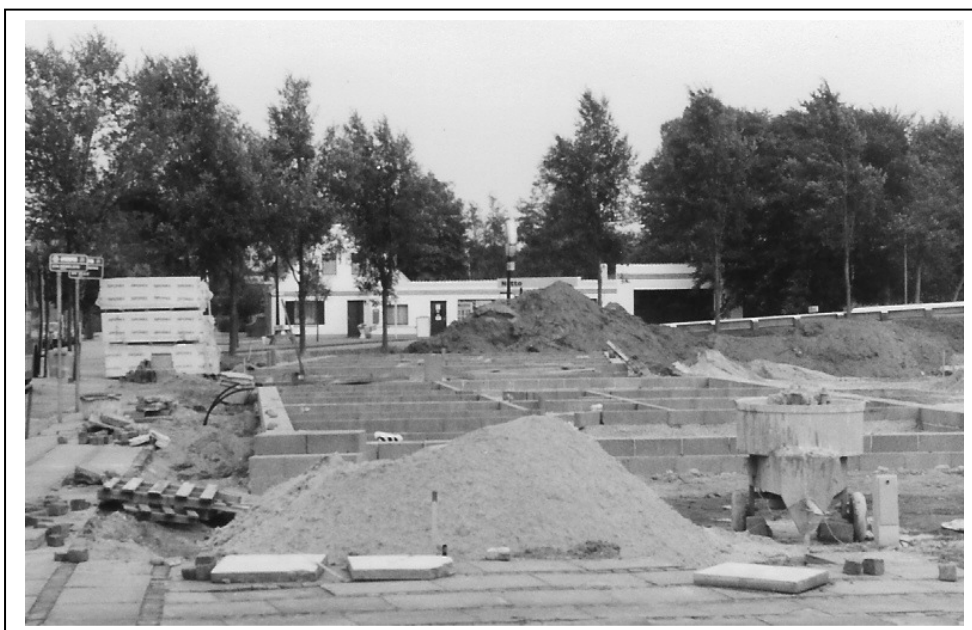
I 1988 gjorde bygningerne plads for nye pensionistboliger.

En epoke er slut, Købmandsgården bestod i næsten 100 år og vi har mange dejlige år at tænke tilbage på.