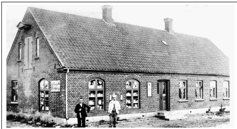
Købmandsgården i al sin storhed, bygget 1897 Arkivfoto 1905 På bill. ses Købmand Jens Pedersen og bror Niels Pedersen

I 1912 blev butik og lagerbygning bygget ud mod Storegade og i 1936 blev lagerbygningen lavet om til manufakturafdeling. Så blev der lavet lager ud i gården og alle kakkelovne blev udskiftet med centralvarme.