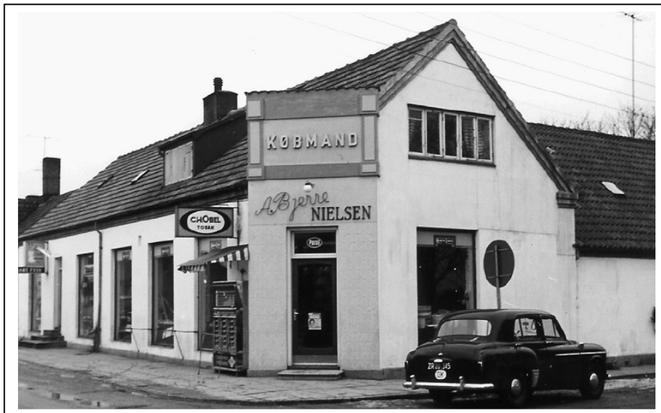
Købmandsgården, med udendørs automat. Først i træsserne. Arkivfoto

Tiderne skifter, der kommer nye salgsmetoder og hen ad vejen moderniserede vi, væltede vægge og indsatte nyt inventar. Mange skuffer forsvandt, der kom nu flere færdigpakkede varer og helt andre dukkede frem på hylderne.